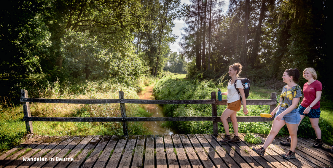
Wandelen in Deurne